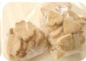
てんさい糖のクッキー