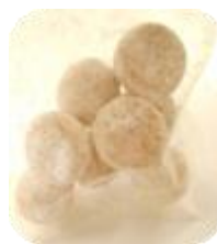
ホワイトクッキー

ホワイトクッキーは、シュクレデコールというお砂糖をまぶした商品、てんさい糖のクッキーはきび砂糖をまぶしています。100円から250円まで、クッキーの枚数に応じた値段設定にしております。